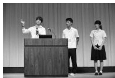
SSH 全国発表会 審査委員長賞受賞