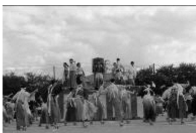
観一祭 デカンショ