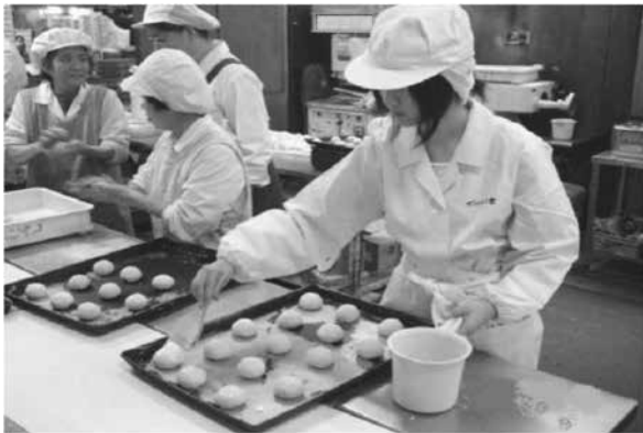
産業現場等における実習

各学校とも進路指導や職業教育の充実に努めており、生徒一人ひとりの適性に 応じた作業学習（学校により違いはありますが、木工、金工、縫工、紙工、窯 業、園芸、清掃など）を行うとともに、実際に企業等で働く産業現場等における 実習（現場実習）を積極的に取り入れています。