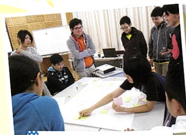
香川県ジュニア・リーダー研修

年間を通じて、行事や体験活動を行っており、季節に関わるものや地域の祭りなど、伝統文化を担っているところもあります。単位子ども会での活動が困難な場合は、複数の単位子ども会が合同で活動したり、校区子ども会や市町子ども会の活動に参加したりしています。子ども会員は基本的に小学生ですが、中学生や高校生世代のお兄さん・お姉さん（ジュニア・リーダー）が活動をサポートしている市町もあります。