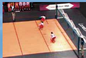
【映像資料(上記はゴールボール)】