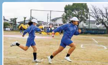
三豊市立勝間小学校 ～リレマラソン～