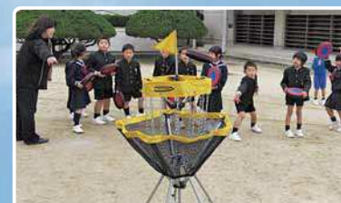
三豊市立比地大小学校 ～フライングディスクゴルフにチャレンジ!～