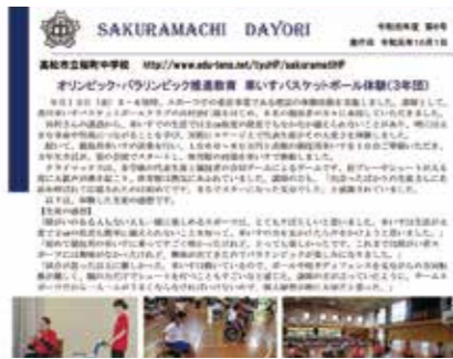
学校だよりでの発信 ～高松市立桜町中学校～