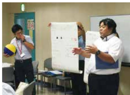
8月23日 オリ・パラを素材にした教材づくり (シッティングバレーボールを素材とした教材づくり)