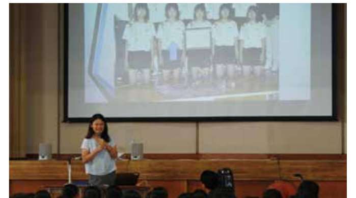
平野加奈子氏(スポーツアナリスト)の講演 ～高松市立香東中学校～