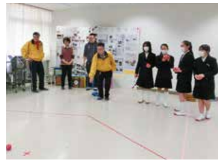
施設の方にポッチャを紹介して、お年寄りの方に伝えてもらう ～東かがわ市立大内小学校～