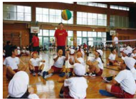
学習参観での発信 ～多度津町立白方小学校～