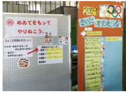
生活目標と関連付けた掲示 ～三豊市立財田小学校～