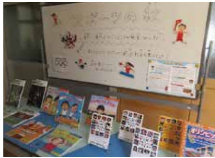
図書コーナーの設置 ～さぬき市立さぬき北小学校～