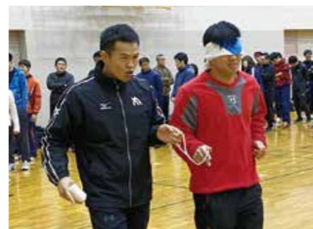
1月29日 オリ・パラ教育フォーラム (ブラインドマラソン体験)