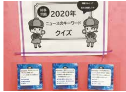
クイズコーナーの設置 ～高松市立一宮中学校～