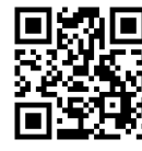
香川県障害者スポーツ協会