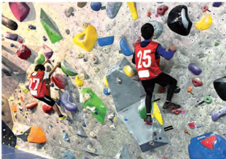
スポーツクライミング