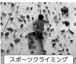
スポーツクライミング

小学校3・4年生の約100名が、走・跳・投の基礎動作を中心としたプログラムに参加しました。各競技の専門の指導者から実技指導を受けたほか、マイスポーツ発見プログラムでは、フェンシング、なぎなた、ウエイトリフティングなど、普段の生活で経験できない競技を体験し、運動に取り組むよききっかけづくりとなりました。