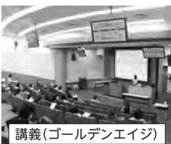
講義(ゴールデンエイジ)