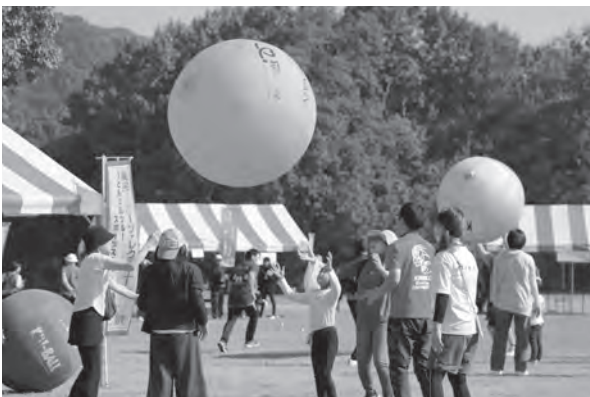
第34回県民スポーツ・レクリエーション祭 R5.11.3 (国営讃岐まんのう公園ドラ夢ドーム)