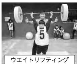
ウエイトリフティング