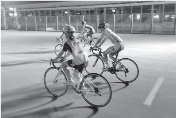
スーパー讃岐っ子育成プログラム (自転車競技体験) R5.9.2 (高松競輪場) 講師：香川県自転車競技連盟