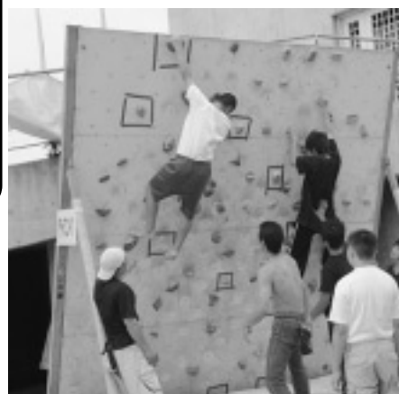
昨年の一場面 クライミング