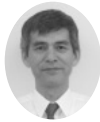
香川県教育委員会事務局保健体育課