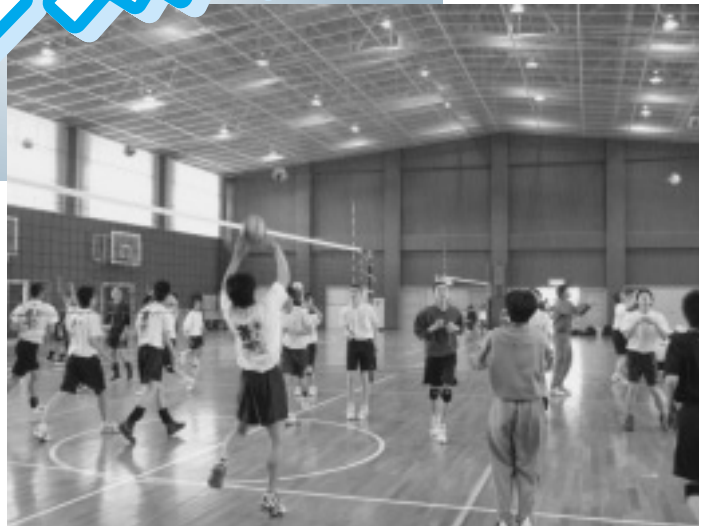
かがわジュニア育成プラン TeamKAGAWA 第1回バレーボール強化練習 H18. 5. 21