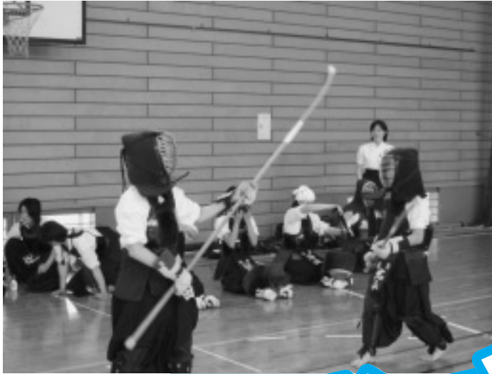
かがわジュニア育成プラン TeamKAGAWA 第1回なぎなた強化練習 H18. 5. 21