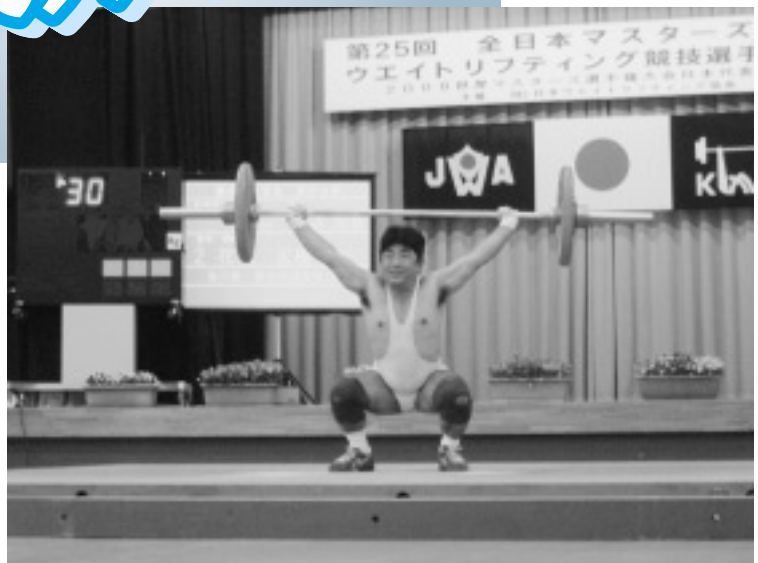
全日本マスターズ重量拳大会 H19. 5. 19~20 於) 多度津工業高校体育館