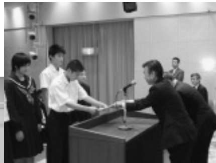
Team KAGAWA指定証交付式 H19. 5. 20 於) 丸亀市綾歌アイレックス