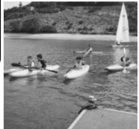
カヌーとセーリング(昨年)

動きださなきゃ始まらない。 まずはチャレンジ! 友達を誘ってぜひ参加しましょう。