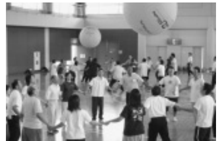
(昨年度の一コマ キンボールより)

主催 香川県教育委員会 受講料 無 料 申込・問合せ先 香川県教育委員会事務局保健体育課 スポーツグループ ☎087-832-3762 (直通)