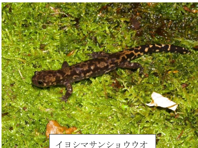
イヨシマサンショウウオ