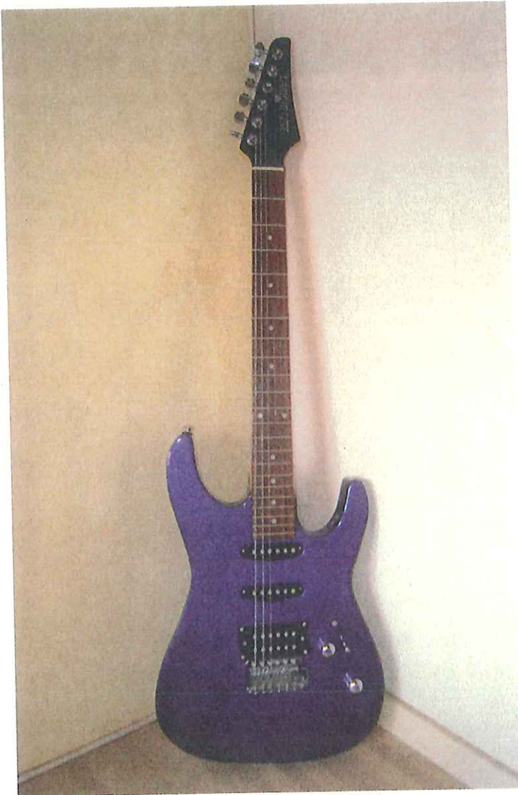
練習を始めたばかりのギター

警察も行政も、犠牲者を増やさないためにも、交通安全意識を高めるためにも啓蒙啓発の方法論を様々な角度から検討すべきだと思う。いずれにしても、私は我が子を交通犯罪で亡くした親として、「生命のメッセージ展」という活動を通して、私ができることを精いっぱい取り組んでいきたいと思っている。