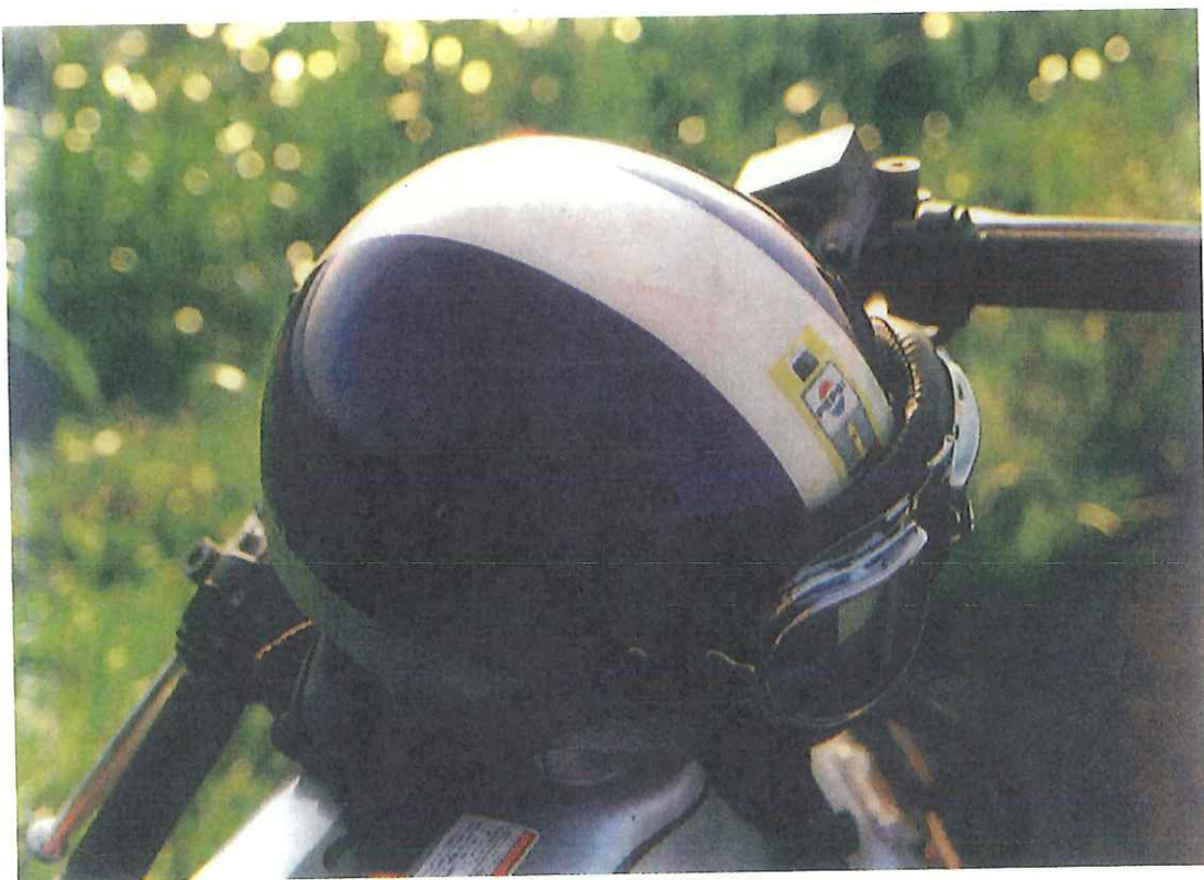
光博のヘルメット～亡くなった北海道で撮影したもの