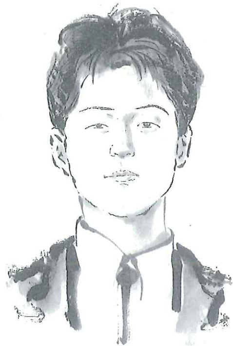
プロの方が書いてくれた息子の肖像画

不意に襲ってくる寂寥感はどうする術もありません。心にしんとしたものを抱えて生きています。