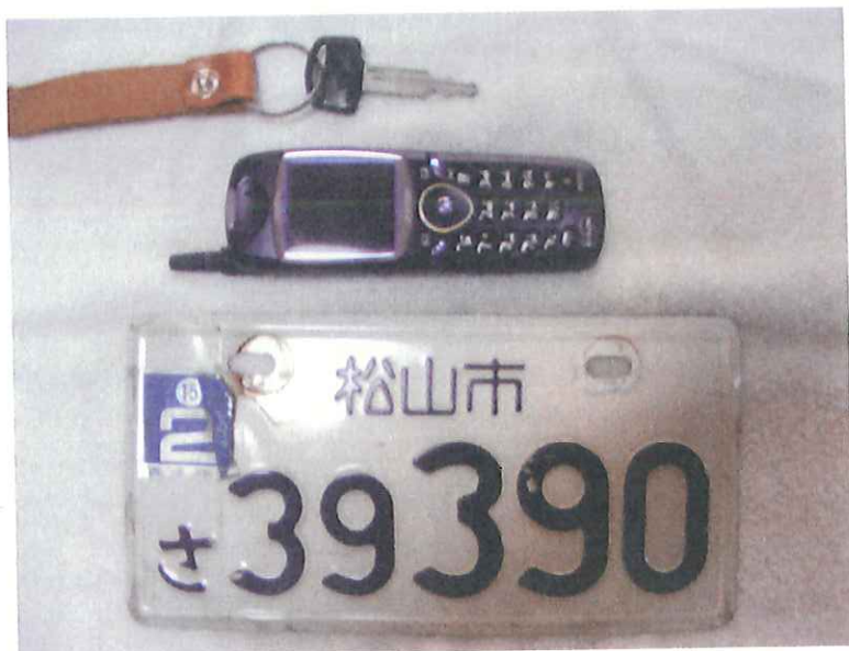
美香の原付エンジンキーとナンバープレート (ナンバーを見た時、美香が「サンキューサン キューお母さん」と言っているように思えた) 事故後も美香が設定していた目覚ましが毎朝鳴り 続けた携帯電話