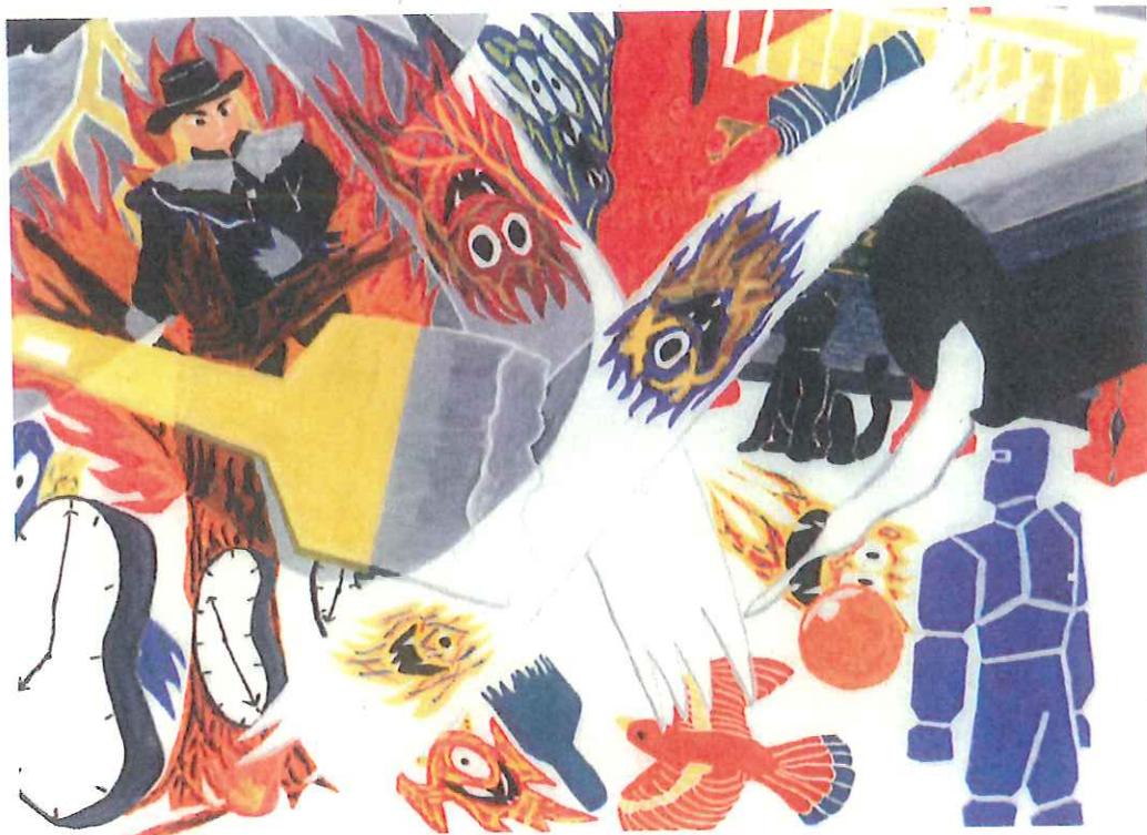
絵画コンクールで入賞した息子の作品