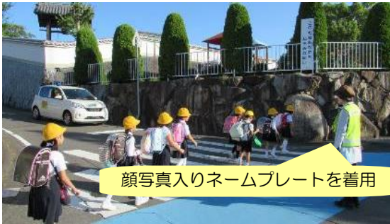
顔写真入りネームプレートを着用