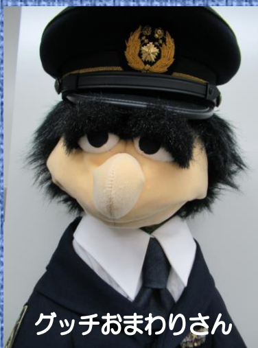
グッチおまわりさん