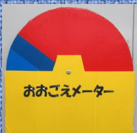
おおごえメーター