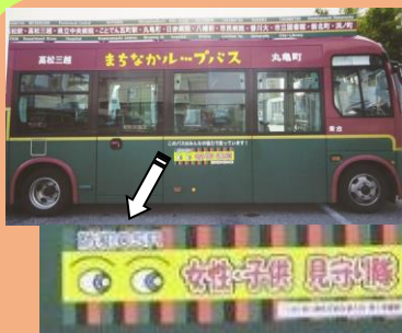
ループバスに見守りマグネットを貼付け(丸亀町商店街振興組合) 自社製品に防犯ロゴ(有限会社筒井製菓)