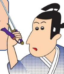
さぬき警察署マスコット 「源内警部」

警察では、自転車運転者の信号無視等に対し、指導警告を行うとともに、悪質・危険な交通違反に対しては検挙措置を講ずるなど、厳正に対処しています。