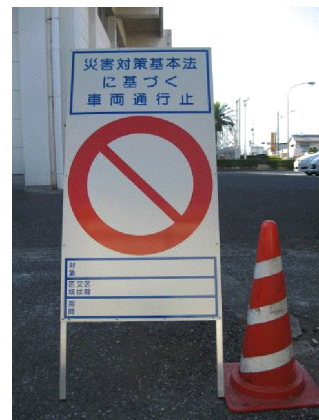
緊急交通路を示す標識