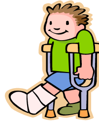
雇用保険や労災保険の保険給付額の改定 など