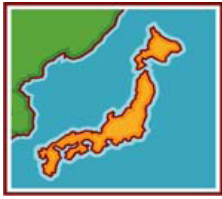
国民所得、県民所得の推計