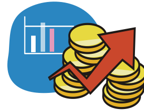
最低賃金決定の資料