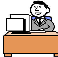
労使間における労働時間、給与等改定の際の参考資料