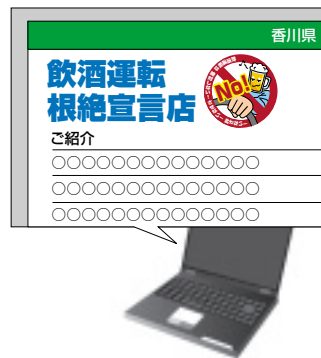
県ホームページでお店の紹介