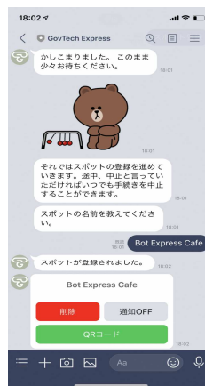
③店舗名称等の質問に回答していくとQRコードを掲載した様式が発行されます。