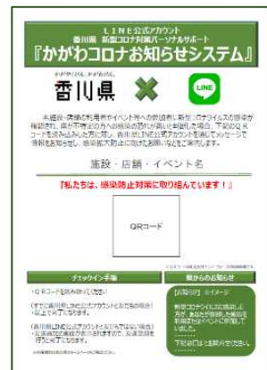
④印刷して店舗等に掲示してください。