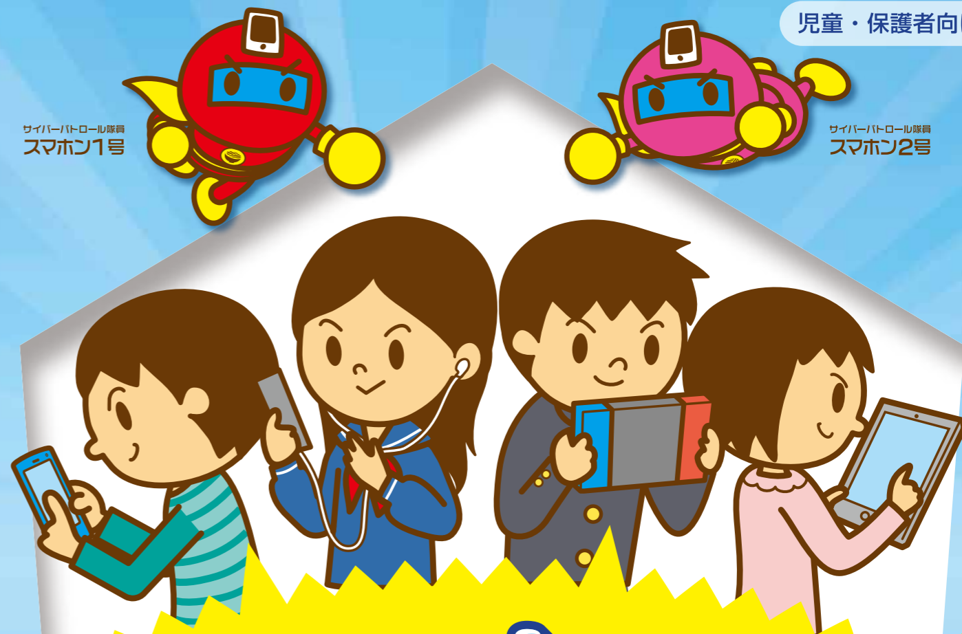
サイバーパトロール隊員 スマホン1号