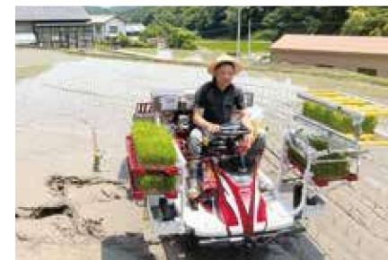
▲補助事業で導入した田植機

※助成単価 1作業 4,000円以内 / 10a（最大3作業 12,000円以内 / 10a）