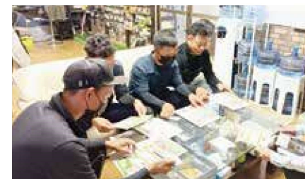
▲グループ設立に向けた話合いの様子