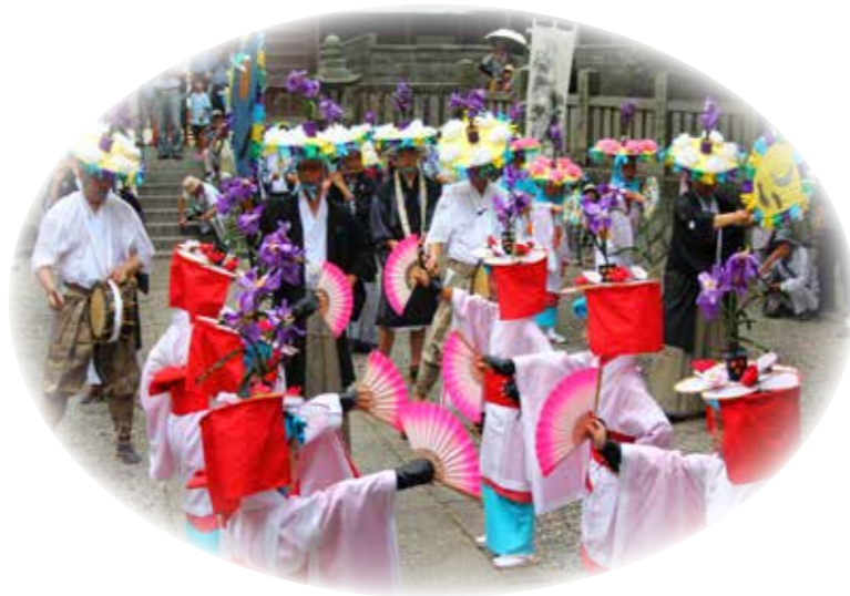
重要無形民俗文化財 綾子踊 (あやこどり)

また、その価値や特性にもとづき、保存や活用について地域総がかりで考えていかなければなりません。