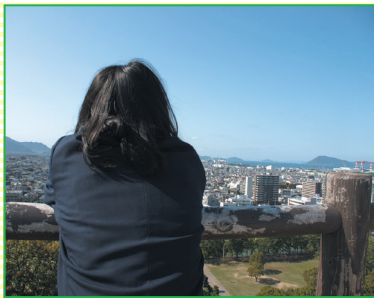
高校生フォトコンテスト 佳作 「いとをかし」