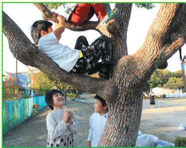
高校生フォトコンテスト 広報委員長賞 「ぼくたちの遊びば」