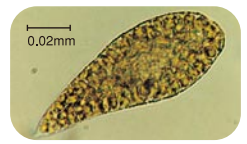
赤潮プランクトン「シャットネラ」

赤潮によって瀬戸内海で養殖していたハマチが大量に死んでしまいました。このように、赤潮が発生すると、プランクトンの種類によっては、一度にたくさんの魚が死ぬことがあります。