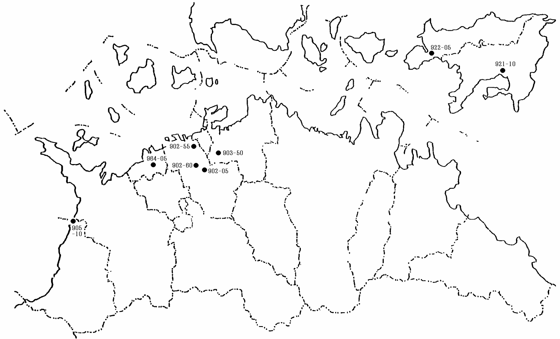
地下水概況調査地点図 1