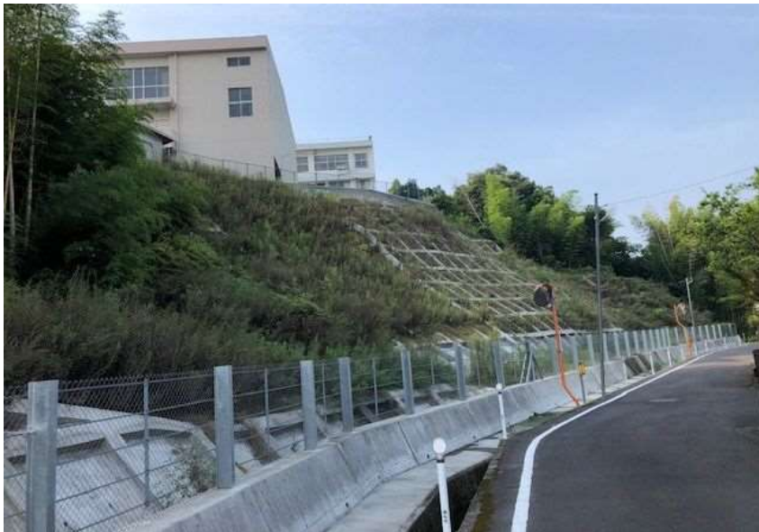
② 急傾斜地崩壊対策事業 (1箇所)