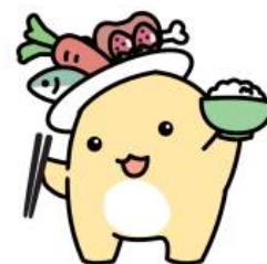
スマート・フードライフ 推進キャラクター「たるる」