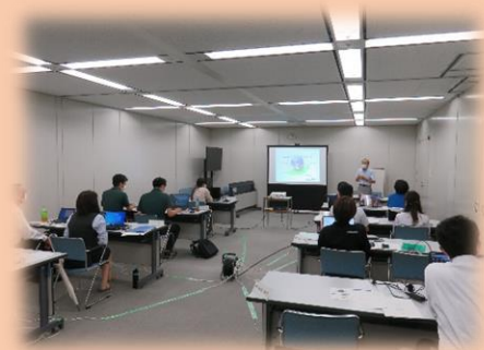
令和4年度セミナーの様子

(事業所の取組み具合にもよりますが、例年、最短で7ヶ月程度で認証取得に至っています。)