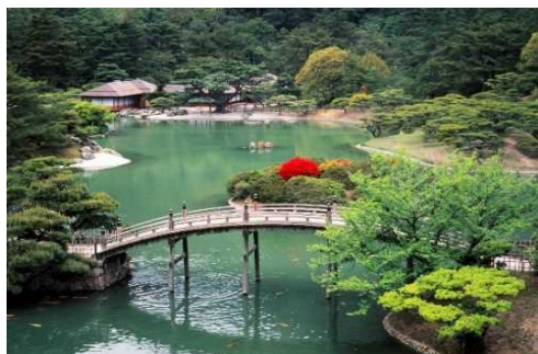
栗林公園の魅力向上