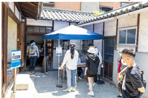
瀬戸内国際芸術祭の運営