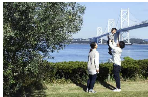
移住・定住の促進