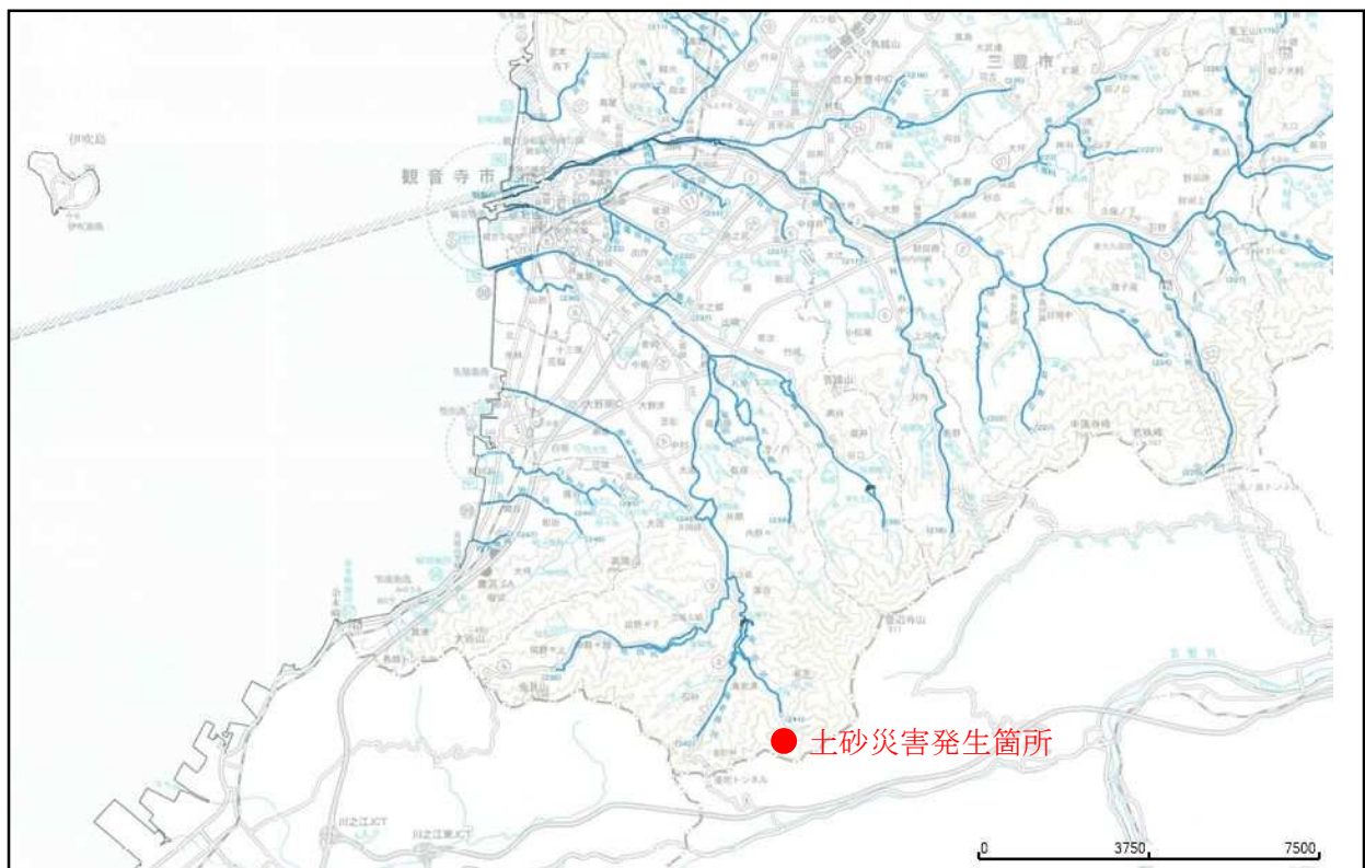
香川県総合管内図（承認番号平 21 四使、第 24 号）