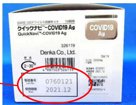
箱の側面に記載されています。