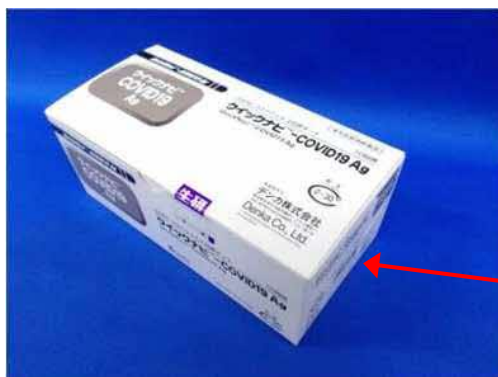
[大塚製薬販売品] 外箱写真