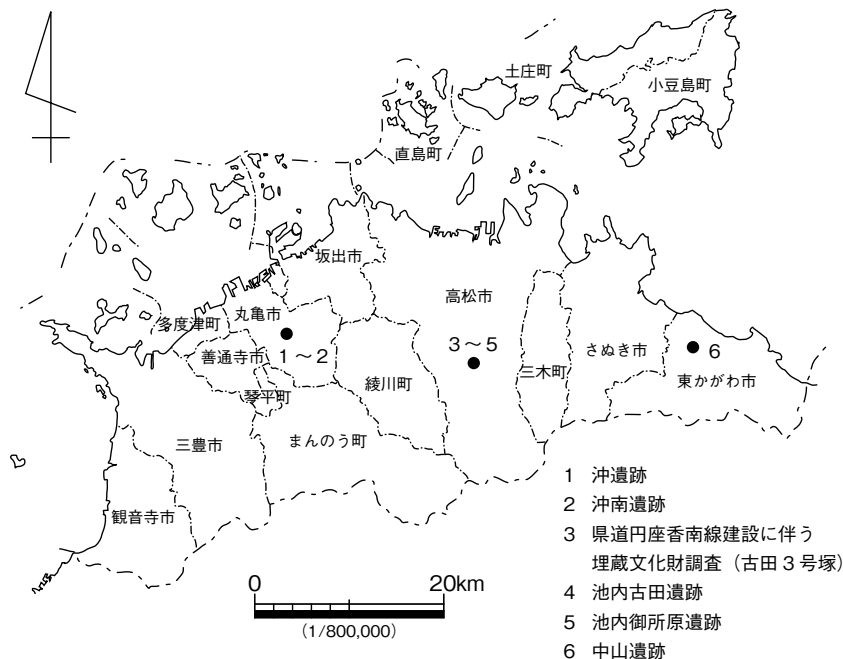
第1図 発掘調査遺跡位置図