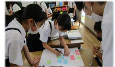
【グループで思考を練る】