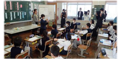
【学級全体でのきき合い】