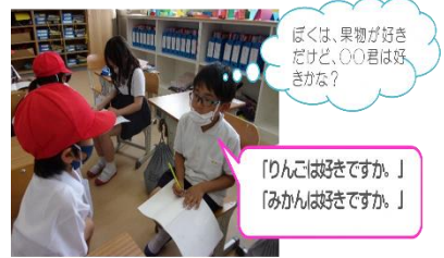
【きく力を高める活動】