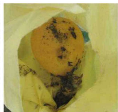
写真3 すず病による果実被害