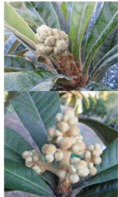
写真 4 固く締まった花蕾(上) 隙間ができた花蕾(下)