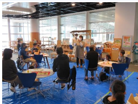
▲かがわの森アンテナショップ (木工工作イベント)