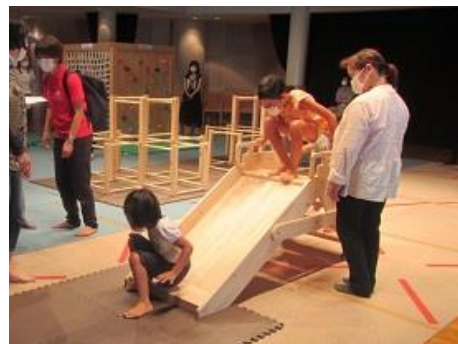
▲モクモクおもちゃ広場の開設状況