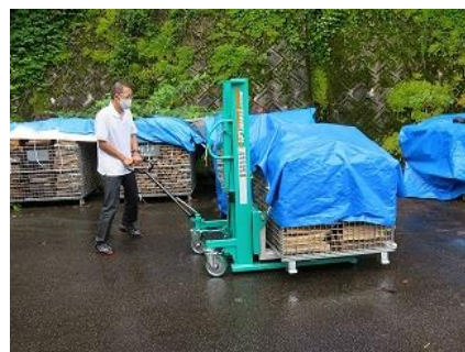
▲ 薪生産拠点への支援