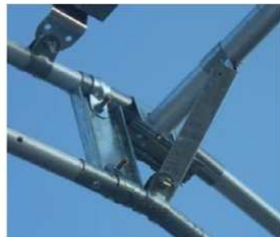
図-19 パイプハウスの強化事例 (アーチ構造の骨材の組み入れ)