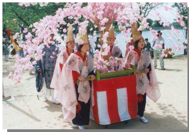
鎮花祭 4月第1日曜日