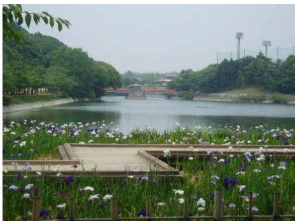
ショウブまつり 6月第1、第2日曜日

4月には約200本の桜による宇佐神社の鎮花祭が、6月には25,000株の菖蒲によるショウブまつりが開催されており、県民の憩いの場になっています。