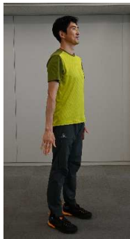
①両足を肩幅に広げて立ちます