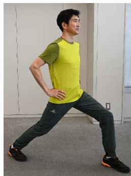
②足をゆっくり大きく前に踏み出します