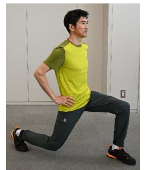
③太ももが水平になるくらいに腰を深く下げます