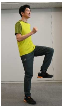
①背筋を伸ばして立った状態から、その場で足踏みをします。