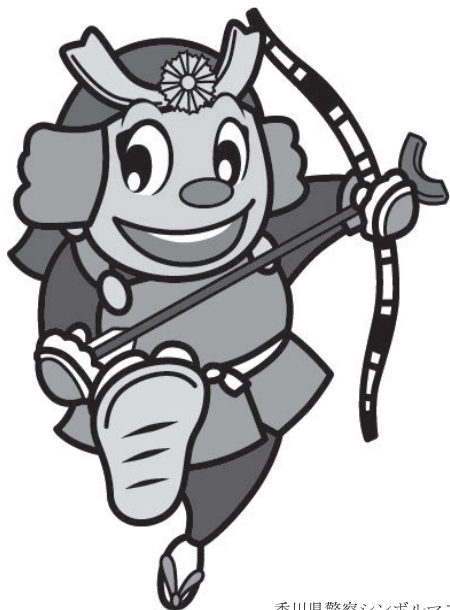
香川県警察シンボルマスコット「ヨイチ」