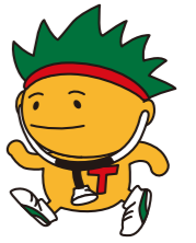
がん征圧イメージキャラクター ソウキくん