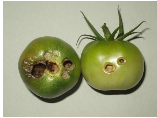
写真2 オオタバコガ幼虫による トマトの食害痕