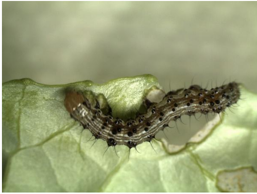
写真1 オオタバコガ老齢幼虫 (体長：約4cm)