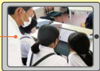
総合的な学習の時間

それまでの授業でまとめた資料を使って自分の意見を整理し、グループで意見交換を実施