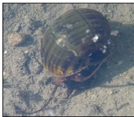
図3. スクミリングオガイ