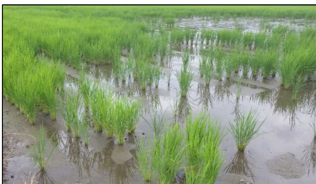
図2. スクミリングオガイによる被害圃場