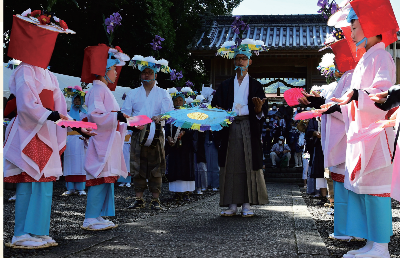
まんのう町の「綾子踊」

2022年11月、モロッコで行われたユネスコ無形文化遺産保護条約政府間委員会で、日本の「風流踊」が無形文化遺産に登録されることが決まりました。風流踊は、華やかな人目を引く衣装や持ち物に趣向を凝らし、歌や笛、太鼓、鉦などの囃子に合わせて踊る民俗芸能で、登録された41件の中に、まんのう町の「綾子踊」と綾川町の「滝宮の念仏踊」が含まれています。全国各地の歴史と風土を反映し、地域で受け継がれてきた風流踊が、注目を集めています。