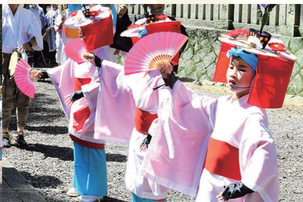
曲に合わせて華麗な踊りを披露する小踊たち