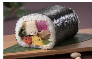
さぬきまるごと恵方巻「骨付鳥」 ※恵方巻に骨は入っていません。

具材はもちろん、シャリのお米も、巻いているノリも、全て県産食材のみで作った「さぬきまるごと恵方巻」。今年は「さぬきまるごと恵方巻“骨付鳥”」が誕生しました。香川の人気グルメ「骨付鳥」のスパシーな味付けを生かしつつ、金時ニンジンやアスパラガスなど旬の県産野菜を巻きました。また、7種類以上の県産食材を使用した、和洋菓子店オリジナルの「さぬき恵方ロール」は新商品を含めて17種類がラインアップ。参加店やメニューはホームページをご覧ください。今年の節分は、香川の魅力がギュッとつまった「恵方巻」と「恵方ロール」でおいしく厄よけ!