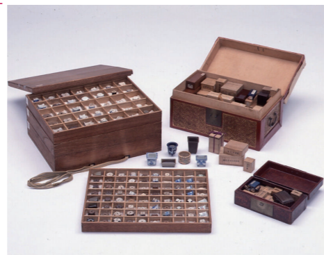
収納箱に収められた鉢や小道具(高松松平家歴史資料)