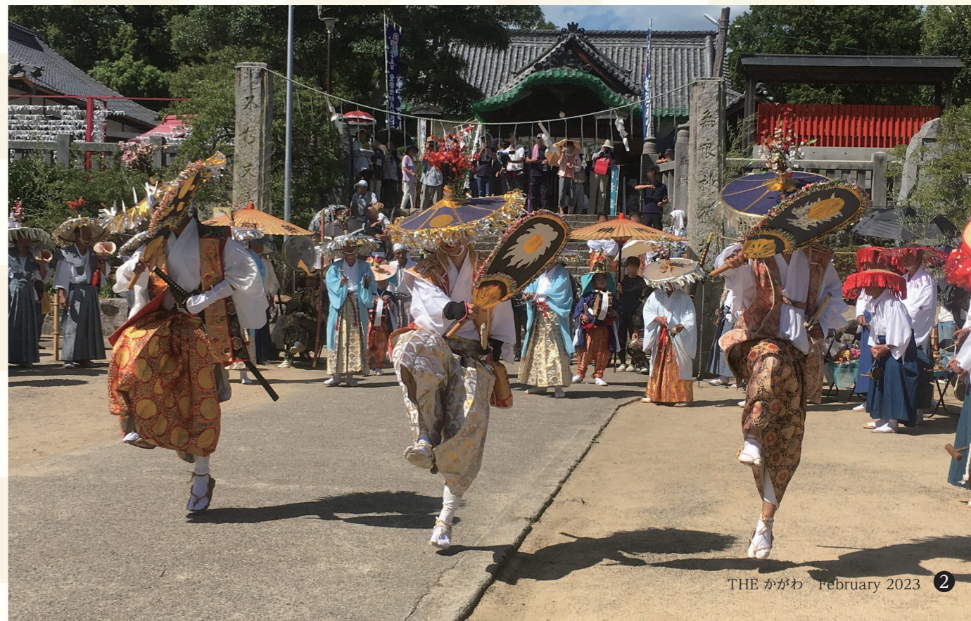
綾川町の「滝宮の念仏踊」