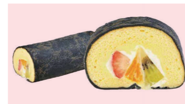
さぬき恵方ロール (17種類あります)