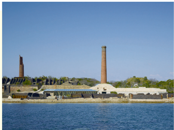
犬島精錬所美術館

岡山県の島で唯一瀬戸内国際芸術祭の会場となっている犬島は、明治時代に多くの人々が島に渡り、銅の製錬業や採石業が盛んに行われていました。隆盛を極めた当時の遺構を生かそうと、2008年に犬島精錬所美術館が開館し、現在は「現代アートの島」として、国内外から多くの人々が島に訪れ、活気を取り戻しています。