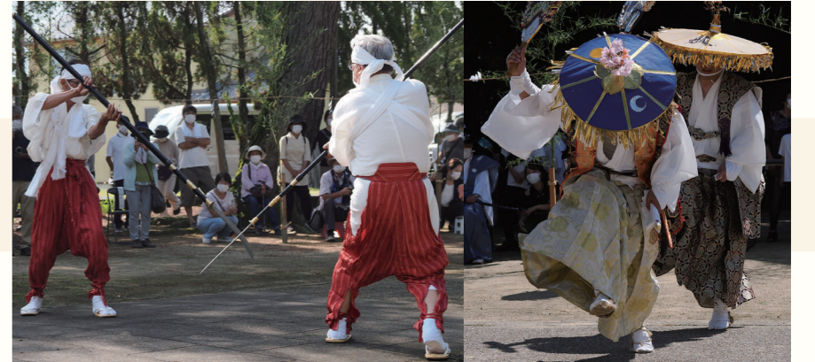
鎌刀(なぎなた)の悪魔払い

滝宮の念仏踊は、陣羽織を着た下知と呼ばれる踊り手が、ホラ貝、鉦、太鼓、笛の囃子と「ナムアミドローヤ」の音頭に合わせて、太陽と月の大うちわを、風で雨雲を起すようなイメージで振りながら踊る躍動感が見どころ。念仏は六つの節があり、それぞれ鉦