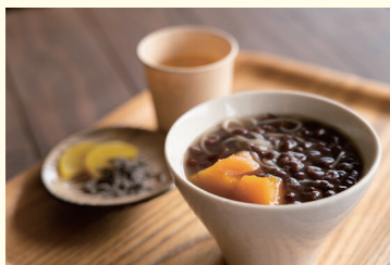
犬島ぜんざい

島で昔から食べられている「犬島ぜんざい」は、甘い小豆のぜんざいの中に、カボチャとそうめんが入っているのが特徴です。犬島は畑作が中心で、高価な砂糖の代わりに島で採れるカボチャを使い、小豆島との交流があったことから餅や団子の代わりにそうめんやうどんを入れていました。島の歴史と食文化が詰まった郷土料理です。