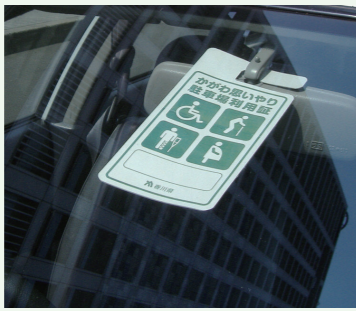
かがわ思いやり駐車場利用証(掲示例)

障害のある人、要介護認定を受けた高齢者、妊産婦など、車いすの利用者や移動に配慮が必要な人たちが安心して駐車場を利用できるように、県は公共的施設などに「かがわ思いやり駐車場」を設けています。 車いすを使用する場合、乗降のために幅3.5以上の駐車スペースが必