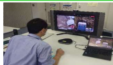
技術者が、カメラ映像を確認し、現場へ指示

・公共工事発注者への施工体制台帳の提出義務を合理化 (ICTの活用で施工体制を確認できれば提出を省略可)