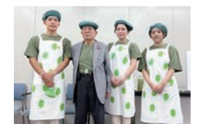
株式会社 松風庵かねすえさん