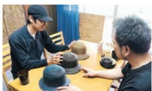
有限会社 丸高製帽所さん