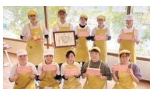
農事組合法人 東山産業さん