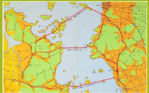
本土-四国連絡瀬戸大橋ルート(案)(昭和38年)