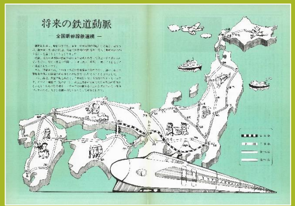
将来の鉄道動脈＝全国新幹線鉄道網(昭和48年)