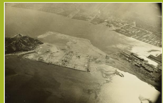
番ノ州地区臨海工業用土地造成事業(第1期工事) 状況写真(昭和43年)