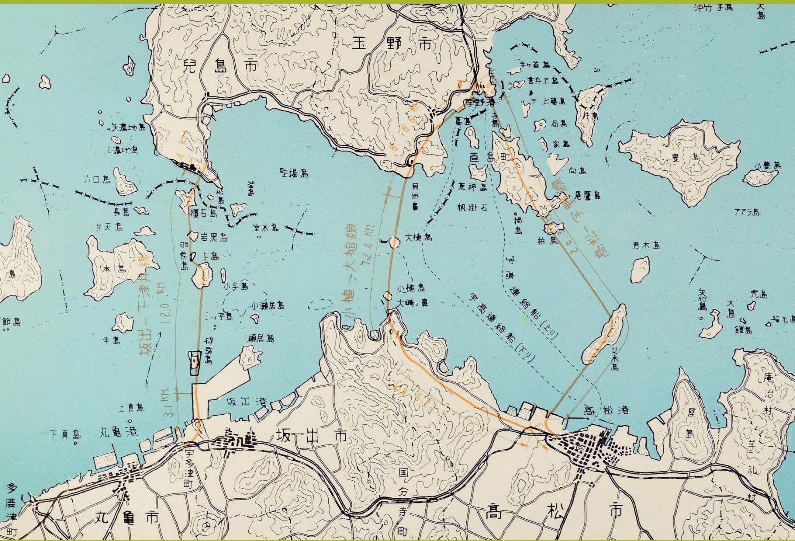
本州と四国を結ぶ瀬戸大橋 架橋計画平面図 (昭和36年)