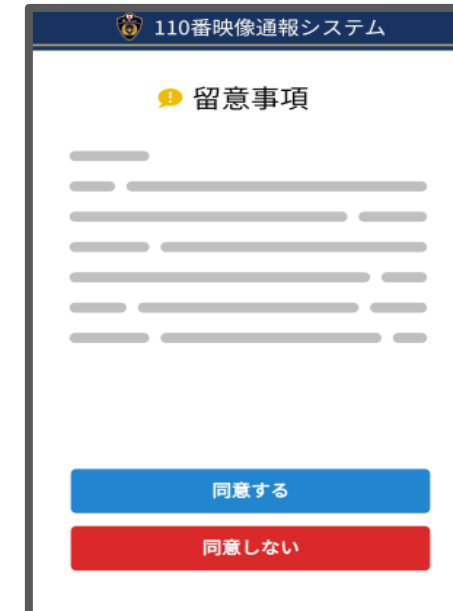
▲留意事項画面のイメージ