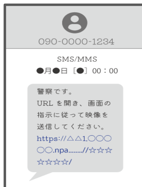
▲SMS受信画面のイメージ

※ 警察庁が適用する設定によっては、通信指令室担当者が口頭で伝えるアクセスコードの入力が必要になる場合があります。