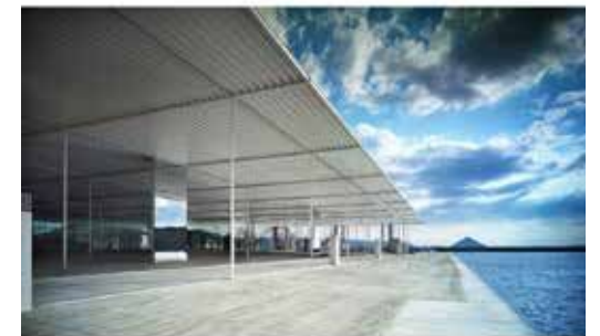
KAZUYO SEJIMA + RYUE NISHIZAWA / SANAA "Marine Station "Naoshima"