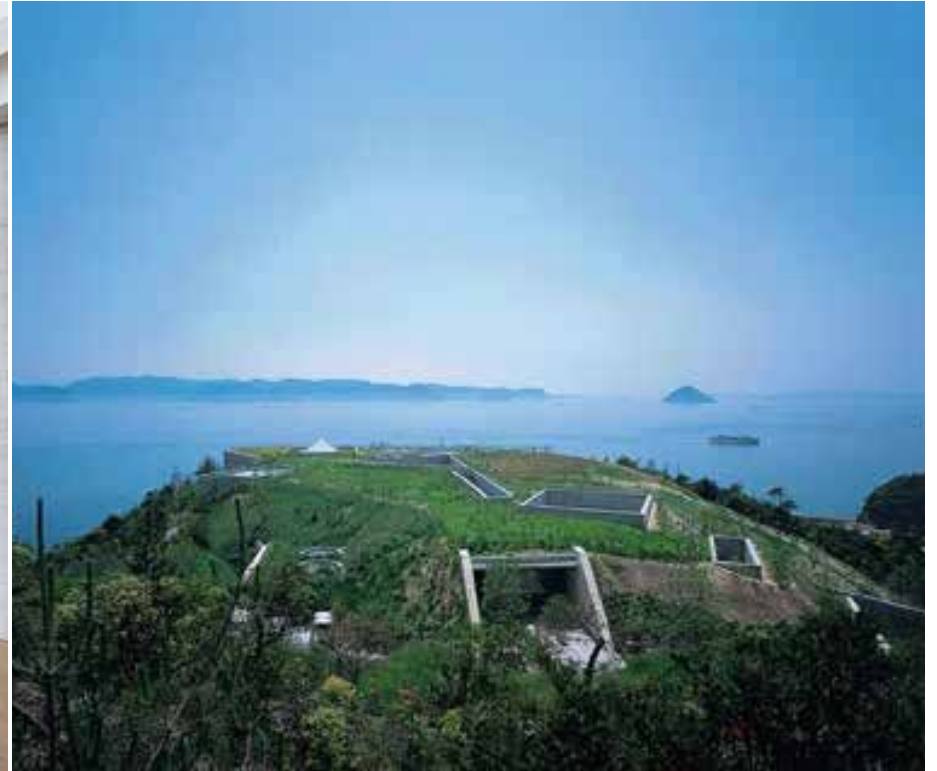
Chichu Art Museum