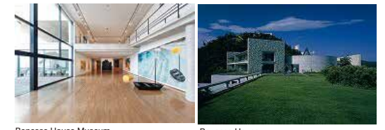
Benesse House Museum

直島アートの原点ともいえる「美術館に泊まれる」ホテル。建築はすべて安藤忠雄の設計、宿泊者限定の鑑賞メニューもあり、24時間アートな時間が楽しめます。