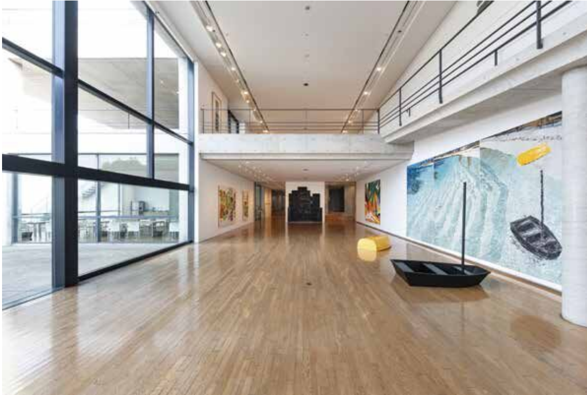
Benesse House Museum