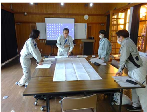
③ 【座学】 地図情報の読み方 森林簿や地図の見方を学び、裸眼立体視 に挑戦しました。