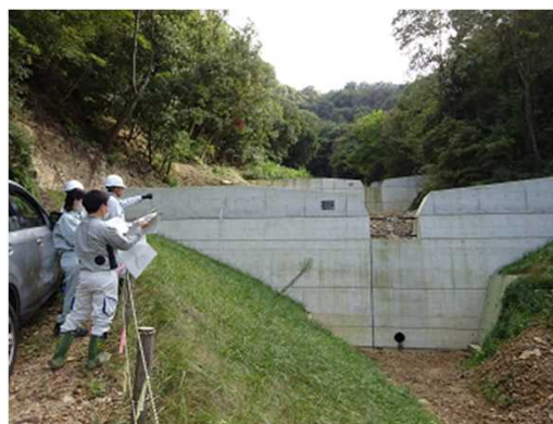
④ 【見学】 治山施設（流木防止総合対策事業） 治山事業の目的を学び、現地で事業計画図面の 見方を学びました。