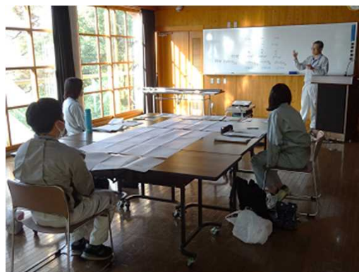
⑥ 【座学】 立木調査結果の活用 材積を求めて、柱材にした場合の1本あたり 価格や立木補償額を計算しました。