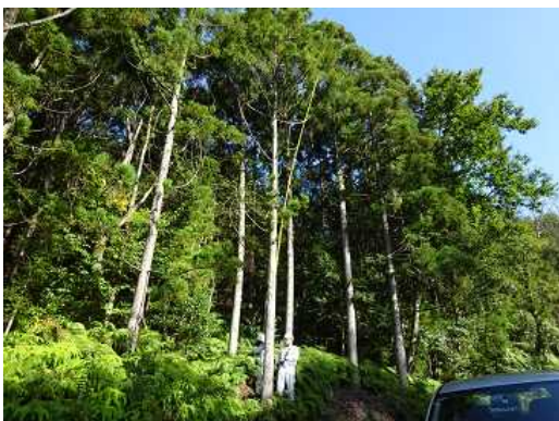
⑤ 【実習】 立木調査 測桿、輪尺、ブルーメライズ測高器を 使って、一人1本スギを測定しました。