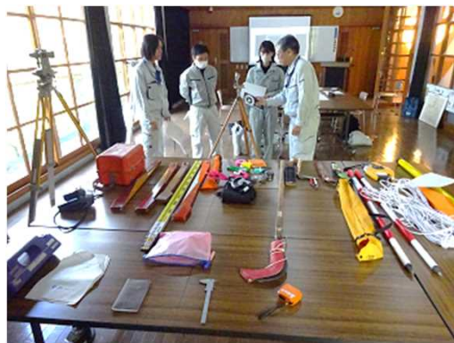
② 【座学】 林業職が業務に用いる道具 ここからは、西部林業事務所の森林土木 技術指導職員による講義です。